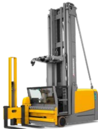
Típus EKX 410-516k* Elektromos magasraktári kommisszió- és felrakótargonca Max. emelési magasság 18 000 mm Teherbírás max. 1600 kg