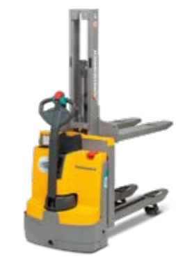
Tipus EMD 115i/118 Elektromos gyalogkísérő targonca két rakodólap egyidejű kezelésére Max. emelési magasság 1520 mm Teherbírás max. 1800 kg