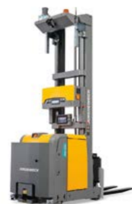
Típus EKS 215a Vezető nélküli targonca Max. emelési magasság 6000 mm Teherbírás max. 1500 kg