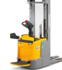
Tipus ERC 212-220 Elektromos gyalogkísérő targonca Max. emelési magasság 6000 mm Teherbírás max. 2000 kg