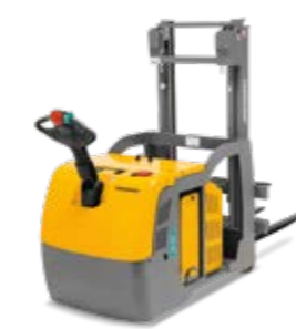
Tipus EJG 106-216 Elektromos gyalogkísérő targonca Max. emelési magasság 5350 mm Teherbírás max. 1600 kg