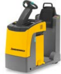
Típus EZS 130 Vontató Vontatható tömeg max. 3000 kg