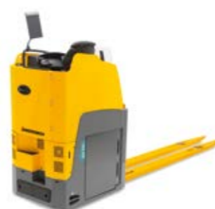
Tipus ESE 220-533 Elektromos vezetőülésses emelőkocsi Teherbírás max. 3300 kg