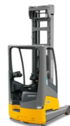
Tipus ETV 216 Elektromos tolóoszlopos targonca Max. emelési magasság 10 700 mm Teherbírás max. 1600 kg