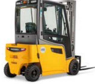
Típus EFG 316-320 Elektromos négykerékű homlokvillás targonca Max. emelési magasság 6500 mm Teherbírás max. 2000 kg