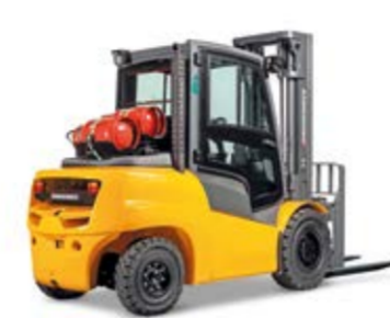
Típus DFG/TFG 540-S50 Dízel-/gázüzemű homlokvillás targonca hidrodinamikus meghajtással Max. emelési magasság 7500 mm Teherbírás max. 5000 kg