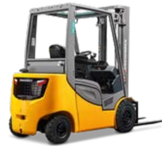
Típus DFG/TFG 316s-320s Dízel-/gázüzemű homlokvillás targonca hidrosztatikus meghajtással Max. emelési magasság 7500 mm Teherbírás max. 2000 kg