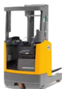
Tipus ETV 110/112 Elektromos tolóoszlopos targonca Max. emelési magasság 7100 mm Teherbírás max. 1200 kg