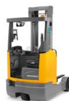
Tipus ETV C16/C20 Elektromos tolóoszlopos targonca Max. emelési magasság 7400 mm Teherbírás max. 2000 kg