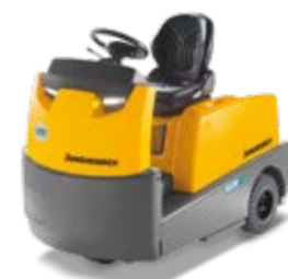
Típus EZS 570/580/590/5100 Vontató Vontatható tömeg max. 10 000 kg