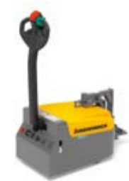
Típus EZS 010 Vontató Vontatható tömeg max. 1000 kg