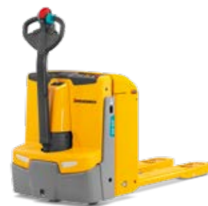
Tipus EJE 222-235 Elektromos gyalogkísérő emelőkocsi Teherbírás max. 3500 kg