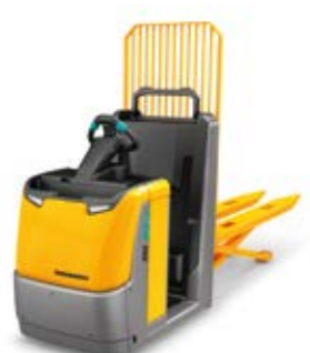
Tipus ECE 310/320 Elektromos horizontális kommissiózó targonca Teherbírás max. 2000 kg Opcionális easyPILOT távvezérléssel