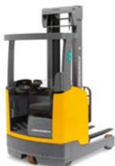
Tipus ETM/ETV 214/216 Elektromos tolóoszlopos targonca Max. emelési magasság 10 700 mm Teherbírás max. 1600 kg