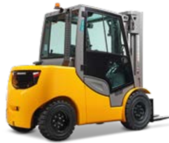
Típus DFG/TFG 540s-S50s Dízel-/gázüzemű homlokvillás targonca hidrosztatikus meghajtással Max. emelési magasság 7500 mm Teherbírás max. 5000 kg