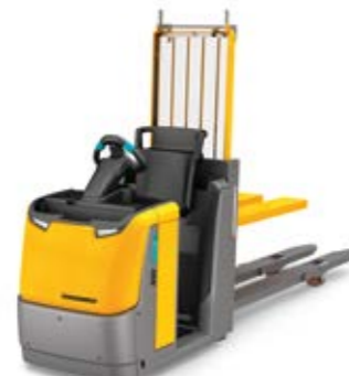
Tipus ECD 320 Elektromos horizontális kommissiózó targonca Teherbírás max. 2000 kg