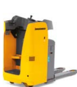
Tipus ESE 120 Elektromos vezetőállásos/ülésses emelőkocsi Teherbírás max. 2000 kg