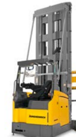
Típus ETX 513a/515a Vezető nélküli targonca Max. emelési magasság 13 000 mm Teherbírás max. 1500 kg