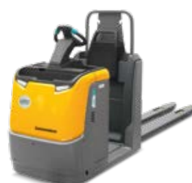
Tipus ECE 220/225 Elektromos horizontális kommissiózó targonca Teherbírás max. 2500 kg Opcionális easyPILOT távvezérléssel