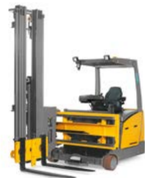
Típus EFX 410-413* Elektromos magasraktári felrakótargonca Max. emelési magasság 7000 mm Teherbírás max. 1250 kg