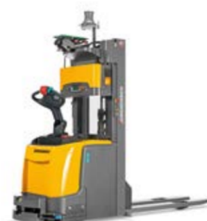
Típus ERC 215a Vezető nélküli targonca Max. emelési magasság 4000 mm Teherbírás max. 1500 kg