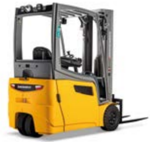
Típus EFG 213-220 Elektromos háromkerékű homlokvillás targonca első kerék hajtással Max. emelési magasság 6500 mm Teherbírás max. 2000 kg