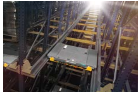
Szatellit kocsis állvány