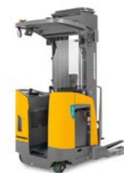
Tipus ETR 230/235/340/345/335d Tolvíllás targonca Max. emelési magasság 11 354 mm Teherbírás max. 2000 kg