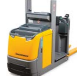
Tipus EKS 110 Elektromos vertikális kommissiózó targonca Kommissiózási magasság max. 4600 mm Teherbírás max. 1000 kg