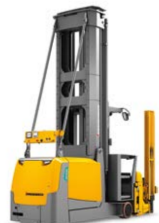
Típus EKX 514a/516ka/516a Vezető nélküli targonca Max. emelési magasság 13 000 mm Teherbírás max. 1600 kg