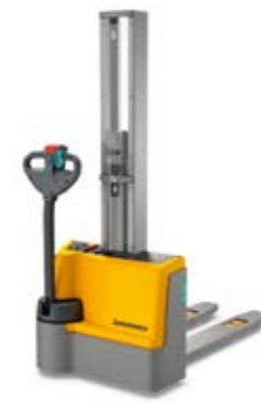
Tipus EJC M10 E/M10b E Elektromos gyalogkísérő targonca Max. emelési magasság 1900 mm Teherbírás max. 1000 kg