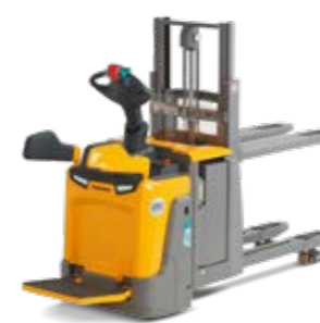
Tipus ERD 120/220 Elektromos gyalogkísérő targonca vezetőállásos két rakodólap egyidejű kezelésére Max. emelési magasság 2905 mm Teherbírás max. 2000 kg