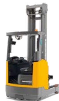
Tipus ETV 318/320/325/ETM 325 Elektromos tolóoszlopos targonca Max. emelési magasság 13 000 mm Teherbírás max. 2500 kg