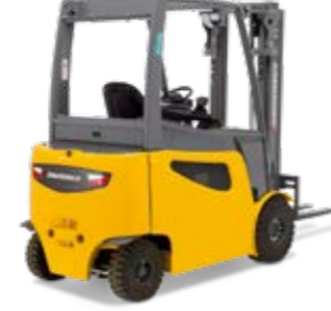
Típus EFG 425-S30 Elektromos négykerékű homlokvillás targonca Max. emelési magasság 7500 mm Teherbírás max. 3000 kg