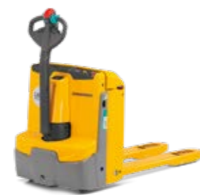
Tipus EJE 114-120 Elektromos gyalogkísérő emelőkocsi Teherbírás max. 2000 kg