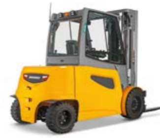
Típus EFG 535k-S50 Elektromos négykerékű homlokvillás targonca Max. emelési magasság 7500 mm Teherbírás max. 5000 kg