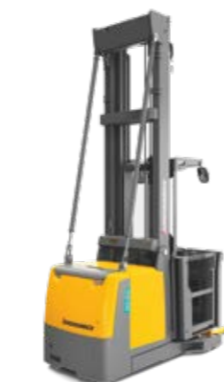
Tipus EKS 210/412s* Elektromos vertikális kommissiózó targonca Kommissiózási magasság max. 14 325 mm Teherbírás max. 1200 kg