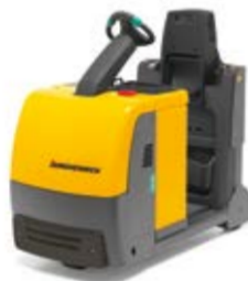
Típus EZS C40 Vontató Vontatható tömeg max. 4000 kg