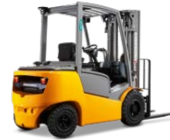
Típus DFG/TFG 425-435 Dízel-/gázüzemű homlokvillás targonca hidrodinamikus meghajtással Max. emelési magasság 7500 mm Teherbírás max. 3500 kg