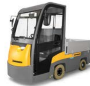
Típus EZW 515 Szállítótargonca Teherbírás max. 1500 kg