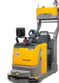
Típus EZS 350a Vezető nélküli targonca Max. emelési magasság 5000 mm