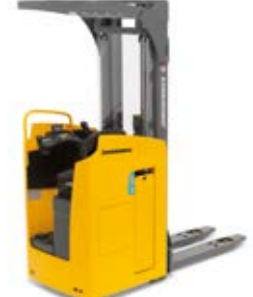
Tipus ESC 214-316 Elektromos vezetőállásos és -ülésses targonca Max. emelési magasság 6200 mm Teherbírás max. 1600 kg