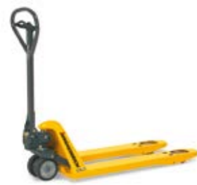
Tipus AM 22/30 Kézi hidraulikus emelőkocsi Teherbírás max. 3000 kg