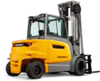
Típus EFG 660-S90 Elektromos négykerékű homlokvillás targonca Max. emelési magasság 7500 mm Teherbírás max. 9000 kg