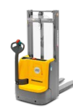
Tipus EJC 110-230 Elektromos gyalogkísérő targonca Max. emelési magasság 6000 mm Teherbírás max. 3000 kg