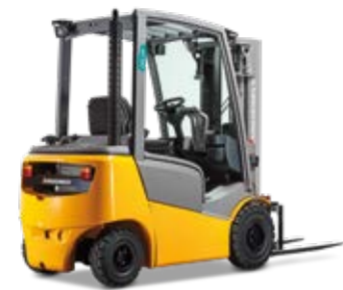
Típus DFG/TFG 316-320 Dízel-/gázüzemű homlokvillás targonca hidrodinamikus meghajtással Max. emelési magasság 7500 mm Teherbírás max. 2000 kg