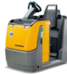
Típus EZS 350 Vontató Vontatható tömeg max. 5000 kg