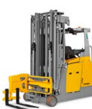
Típus ETX 513-515* Elektromos magasraktári felrakótargonca Max. emelési magasság 13 000 mm Teherbírás max. 1500 kg