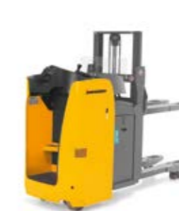
Tipus ESD 120/220 Elektromos oldalülésses targonca Max. emelési magasság 1960 mm Teherbírás max. 2000 kg