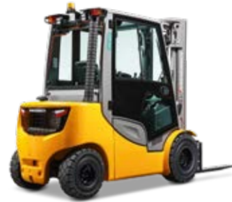
Típus DFG/TFG 425s-435s Dízel-/gázüzemű homlokvillás targonca hidrosztatikus meghajtással Max. emelési magasság 7500 mm Teherbírás max. 3500 kg