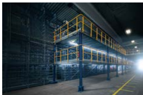
Acélszerkezetes galériás tároló