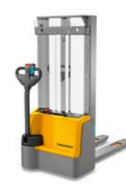
Tipus EJC M10 ZT/M13 ZT Elektromos gyalogkísérő targonca Max. emelési magasság 3300 mm Teherbírás max. 1300 kg