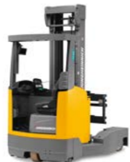
Tipus ETV Q20/Q25 Elektromos többutas targonca Max. emelési magasság 10 700 mm Teherbírás max. 2500 kg