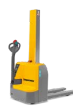
Tipus EMC 110/B10 Elektromos gyalogkísérő targonca Max. emelési magasság 1540 mm Teherbírás max. 1000 kg