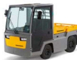
Típus EZS 7280 Elektromos vontató Vontatható tömeg max. 28 000 kg