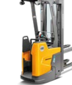
Tipus ERC 216zi Elektromos vezetőállásos targonca Max. emelési magasság 6000 mm Teherbírás max. 1600 kg