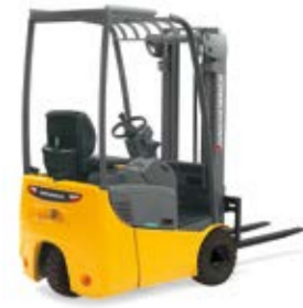
Típus EFG 110-115 Elektromos háromkerékű homlokvillás targonca hátsókerék hajtással Max. emelési magasság 6500 mm Teherbírás max. 1500 kg