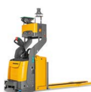
Típus ERE 225a Vezető nélküli targonca Max. emelési magasság 122 mm Teherbírás max. 2500 kg