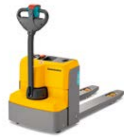
Tipus EJE M13/M15 Elektromos gyalogkísérő emelőkocsi Teherbírás max. 1500 kg