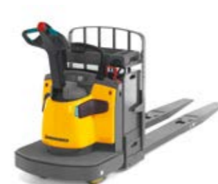
Tipus ECR 327/336 Elektromos horizontális kommissiózó targonca Teherbírás max. 3600 kg