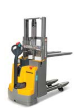
Tipus EJD 118/220 Elektromos gyalogkísérő targonca két rakodólap egyidejű kezelésére Max. emelési magasság 2560 mm Teherbírás max. 2000 kg