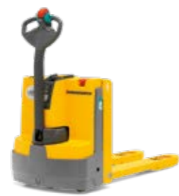
Tipus EJE 112i/114i Elektromos gyalogkísérő emelőkocsi lítiumion akkumulátorral Teherbírás max. 1400 kg