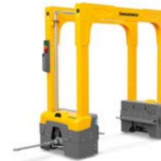
Típus GTP 110/210/216 Portál alakú vontatmány kétoldali rakodási lehetőséggel Teherbírás max. 1600 kg