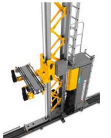
Típus STC 2B1A Magasraktári felrakógép Max. emelési magasság 15 000 mm Teherbírás 2 x 50 kg