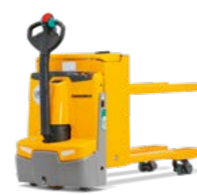
Tipus EJE C20 Elektromos gyalogkísérő emelőkocsi Teherbírás max. 2000 kg