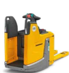
Tipus ERE 120/125/225/230 Elektromos vezetőállásos emelőkocsi Teherbírás max. 3000 kg