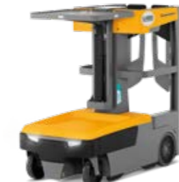
Tipus EKM 202 Darabárú kommissiózó targonca Kommissiózási magasság max. 5324 mm Teherbírás max. 215 kg