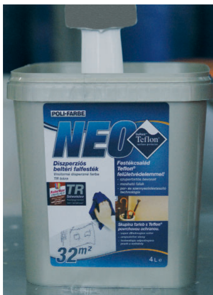
A Poli-Farbe Neo a 2010-es év piaci festék-innovációja