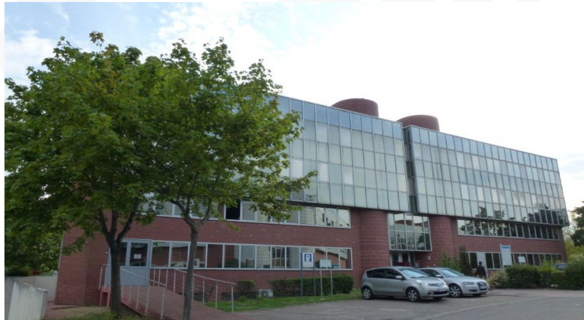
Agatec „főhadiszállás” Le Pecq-ben, Franciaországban

◆ Az 1992-ben Franciaországban alapított vállalat mára az építőipari lézertechnológia egyik vezető globális szállítójává vált. 2007-ben a Hexagon csoport ( www.hexagon.se ) része lett. A Hexagon AB stratégiája, hogy a világ legjobban teljesítő mérés-technikai vállalatait (így került 2007-ben a Leica Geosystems is a tulajdonába), vagy az azokkal kapcsolatos beszállítókat, integrátorokat felvásárolja, de meghagyja azokat eredeti - jól működő - szervezeti formájában és piaci hatékonyságot jelentő szinergikus kapcsolatokat épít ki közöttük. Ebből következik többek között az Agatec márka képviselőjének magyarországi leányvállalatunkhoz rendelése. Ennek eredményeként az építőipari lézerek területén az ügyfelek jóval szélesebb műszaki és pénzügyi igényeit is képesek leszünk ellátni a jövőben. 2011. szeptember. 1.-től magyarországon az Agatec képviselőjét (is) a Leica Geosystems Hungary Kft látja el.