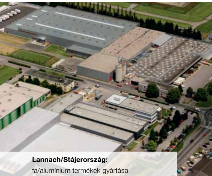
Lannach/Stájerország: fa/alumínium termékek gyártása