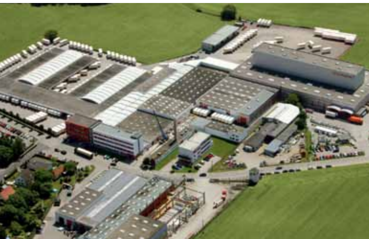
Traun/Felső-Ausztria: műanyag ablak, szigetelőüveg és alumínium termékek gyártása