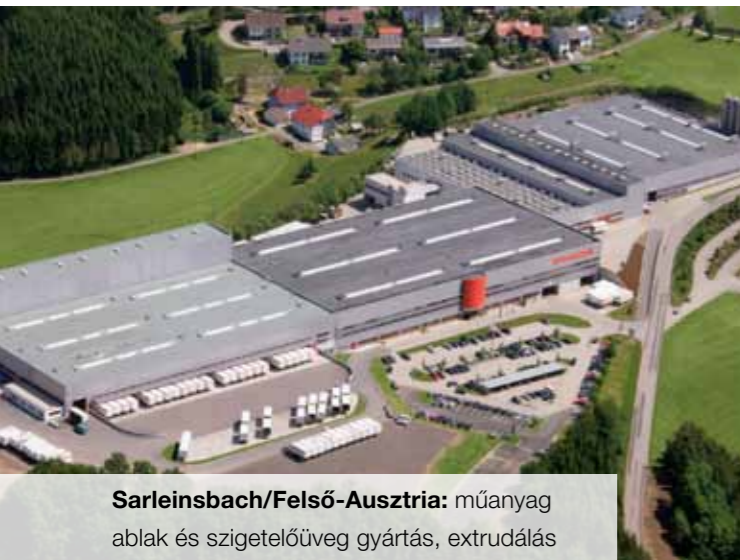
Sarleinsbach/Felső-Ausztria: műanyag ablak és szigetelőüveg gyártás, extrudálás